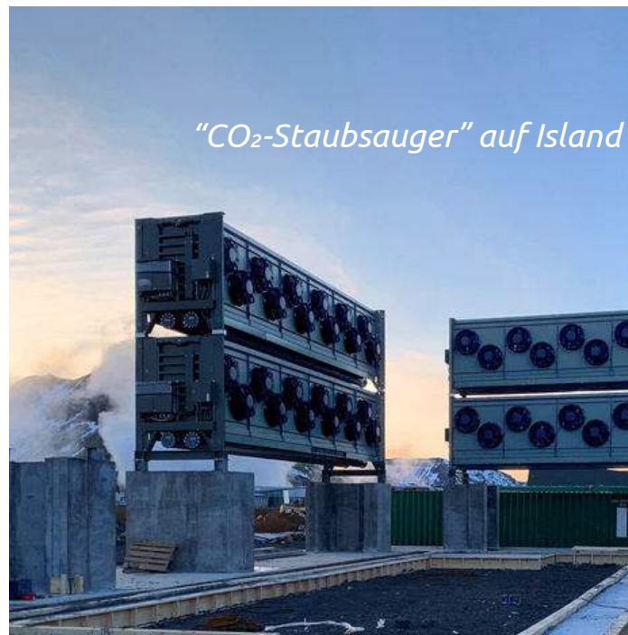
“CO 2 -Staubsauger” auf Island